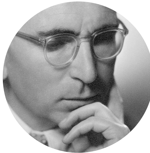
Viktor Frankl - Créateur de l'AEL